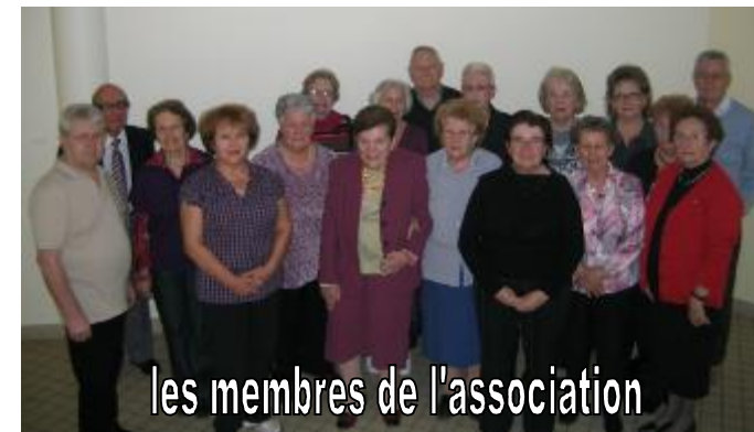
les membres de l'association

Signataire d'une convention avec l'EHPAD, l'association les « Amis des Anciens » intervient avec respect auprès des personnes âgées et s'engage à être garant de la confidentialité de toutes les informations.